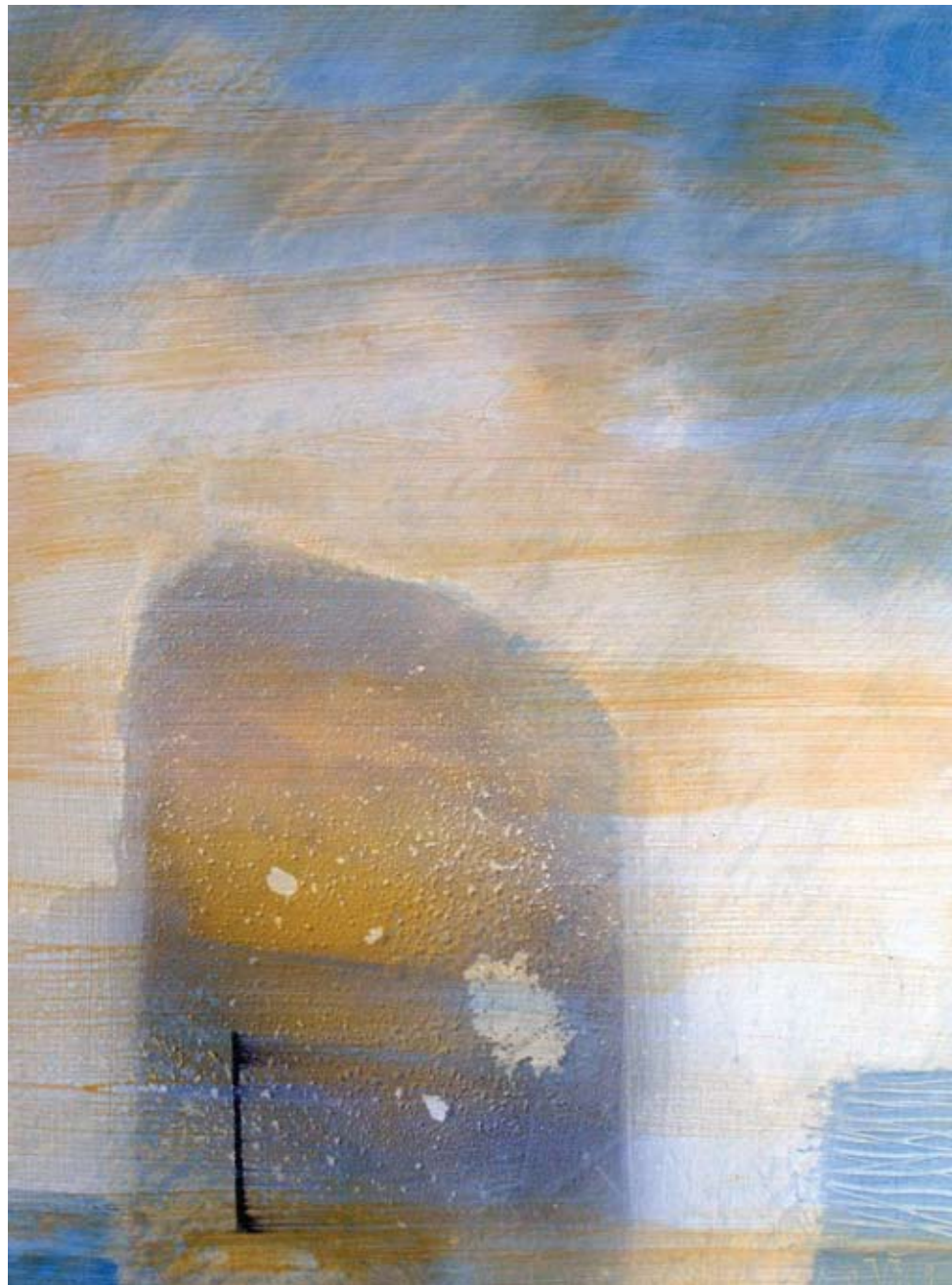
BN 114 akril 58 x 41 cm 2009